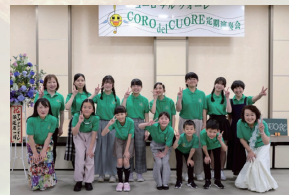
コーロ・デル・クオーレ