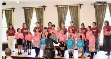
善通寺少年少女合唱団